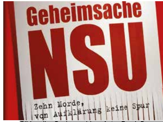
Bildquelle: Buchumschlag, Autor, Frank Brunner verpflichtet.

Nun ist es doch herausgekommen. Dieser Bericht ist 250 Seiten dick. Man könnte meinen, es handelt sich hier beim Bekanntwerden des Berichts - wie immer - um eine Panne oder ein ganz persönliches Versagen. Aber nein, denn selbst die, die ihn - geschwärzt - einsehen konnten, waren und sind zum Stillschweigen