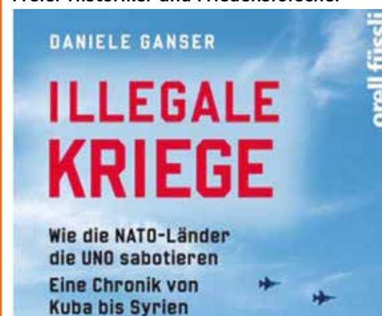
Bildquelle: Buchumschlag, Autor, Daniele Ganser

Mit der Gründung der UNO gilt ein weltweites Kriegsverbot. Nur in zwei Ausnahmen sind kriegerische Maßnahmen zugelassen (Selbstverteidigung oder Mandat des UNO-Sicherheitsrats). Die Realität ist jedoch eine ganz andere. Dieses Buch beschreibt, wie in Vergangenheit und Gegenwart illegale Kriege geführt werden. Es zeigt, wie die Regeln der UNO und vor allem das Kriegsverbot gezielt sabotiert wurden und welche unrühmliche Rolle hierbei die Länder der NATO spielen. Es ist ein Buch von beklemmender Aktualität.