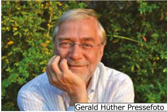
Gerald Hüther Pressefoto

Ein Interview, ursprünglich für „Psychologie heute“, das den Zusammenhang der Entstehung von ADHS-Symptomen mit den von Kindern in unserer gegenwärtigen Gesellschaft gemachten sozialen Erfahrungen beleuchtet: