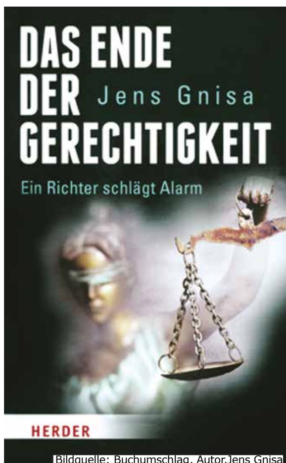
Bildquelle: Buchumschlag, Autor, Jens Gnisa